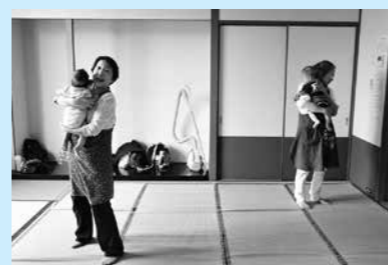
「子育てサロン」で託児サービスを行う委員の皆さん

お困り事やご心配なことがありましたら、担当地区の民生委員・児童委員へお気軽にご相談ください。