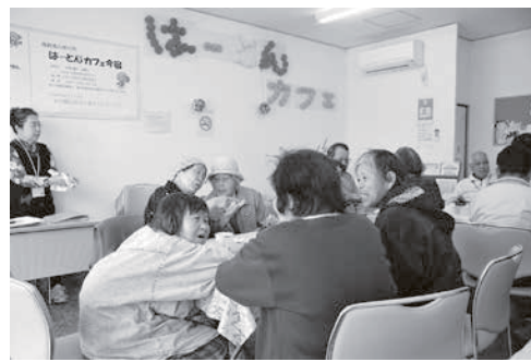
「はーとんカフェ今宿」で談笑する利用者

に立ち寄り和らげたり、お出かけの帰りに立ち寄りたりと気軽に利用されています。 管理人も「皆さんが、すごく楽しく話し、すっきりした表情で帰っていきます。一人暮らしの高齢者が不安で生活している中で、このカフェは誰かが話を聞いてくれる場所となっております。これからもこの場所を大切にしていきたいです」と話していました。