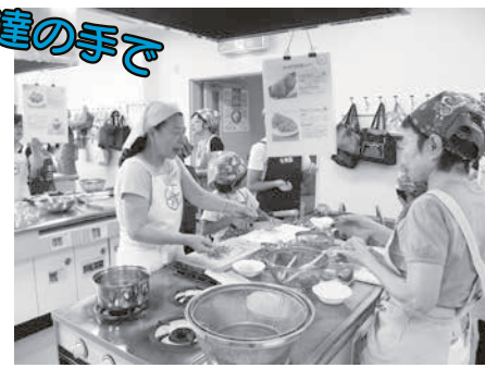
鳩山町食生活改善推進員活動の様子

食生活改善推進員は、地域の人と一緒に「食」について勉強し、健康づくりのボランティアとして活動しています。町では、食生活改善推進員が「私達の健康は私達の手で」をスローガンに、正しい食生活の知識が高まるよう、さまざま