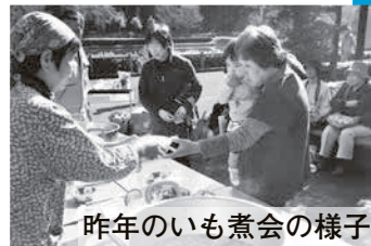
昨年のいも煮会の様子