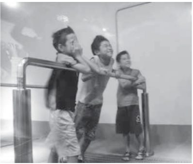
暴風を体験する児童

め、コントロールも容易です。レシーブが重要なため、力のある男性だけでなく、女性も多く活動しています。 メンバーは付き合いが良く楽しい方ばかりで、未経験者も多くいます。健康・体力維持にもなりますので、一緒に心地よい汗を流しましょう。ぜひ気軽に見学にお越しください。