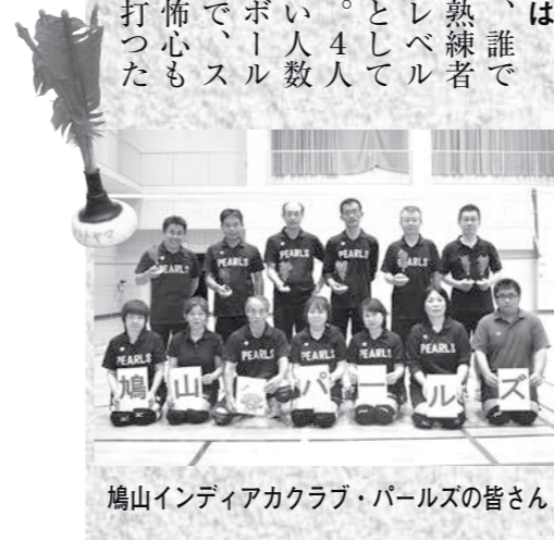
鳩山インディアカクラブ・パルズの皆さん

活動内容は、羽の付いたボールを手で打ち合う、バレーボールタイプのスポーツ「インディアカ」を楽しむクラブです。町民体育館での練習や、西部・比企地区などの大会への参加、会員以外も楽しめる公開教室や、会員同士でバーベキューや新年会などを行い、健康増進と親睦を目的に活動しています。 インディアカの魅力は、いつでも、どこでも、誰でも楽しめる、初心者から熟練者まで、さまざまな人がレベルに応じて、遊技・競技として楽しめるスポーツです。4人制が基本のため、少ない人数でも試合ができます。ボールに羽が付いていることで、スピードも緩和され、恐怖心も感じにくく、直接手で打つた