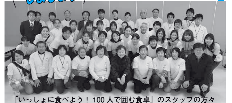
「いっしょに食べよう！100人で囲む食卓」のスタッフの方々