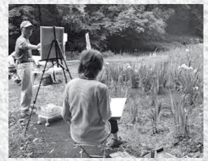
花菖蒲をスケッチする皆さん

「活動内容は 絵を描くことが好きで、上達を目指す同好の集まりです。分野は日本画、水彩画、油絵、ペン画など、また、活動での画題も、静物、人物、風景(屋外への写生会)などさまざまです。年度の初めにメンバーで話し合い、年間の活動計画を決めています。年1回ほど、展覧会で各自の作品を発表しています。 「サークルの魅力は サークルの特徴であり大きな魅力は、自由な雰囲気と、特定の先生がいらないことで、各自の個性や表現が尊重され、多彩な作品が生まれていることです。また、メンバーもさまざまな経歴や特技をお持ちの方が多く、活動を通じて、豊かな人間関係が築け、有意義な情報交換も図れます。 「メッセージをお願いします 皆さん親しみやすい方ばかりですので、すぐに打ち解けることができます。分からないことも聞き合え、和気あいあいと絵を楽しんでいます。見学も自由ですので、ぜひ一度お越しください。