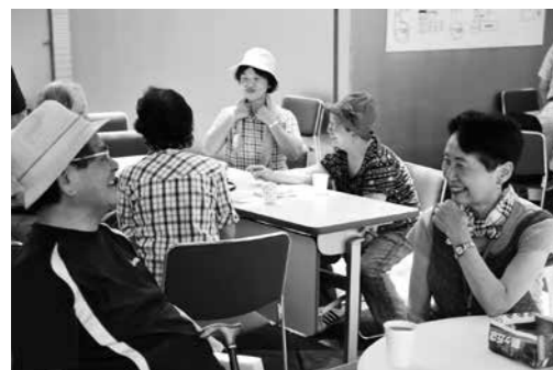
オープンカフェで談笑する方々(昨年度)

ふくしプラザをより多くの方に利用していただき、町内住民の皆さんの交流が深められるよう、「第2回七夕&オープンカフェ」を開催します。子どもから高齢者まで楽しめる企画を考えています。ぜひお気軽にお越しください。 また、6月2日(月)から、ふくしプラザで七夕飾り作りを始めます。皆さんの夢を短冊に託し、一緒に飾りを作ります。ぜひご参加ください。 ■日時 7月5日(土)・6日(日) 午前10時～午後5時 (オープンカフェは午後3時まで) ■場所 ニュータウンふくしプラザ前広場 ■主催 町健康福祉課・町社会福祉協議会 ■運営 ふくしプラザイベント実行委員会 ■問合せ ニュータウンふくしプラザ ☎290・5469 (祝日休み)