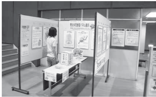
昨年度の展示風景