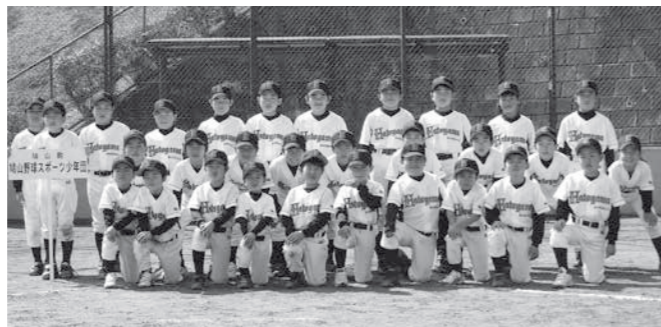
鳩山野球スポーツ少年団の皆さん

このコーナーでは、皆さんからの写真をお待ちしています。コメントもいっしょに送ってね。