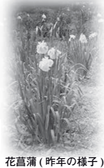
花菖蒲(昨年の様子)