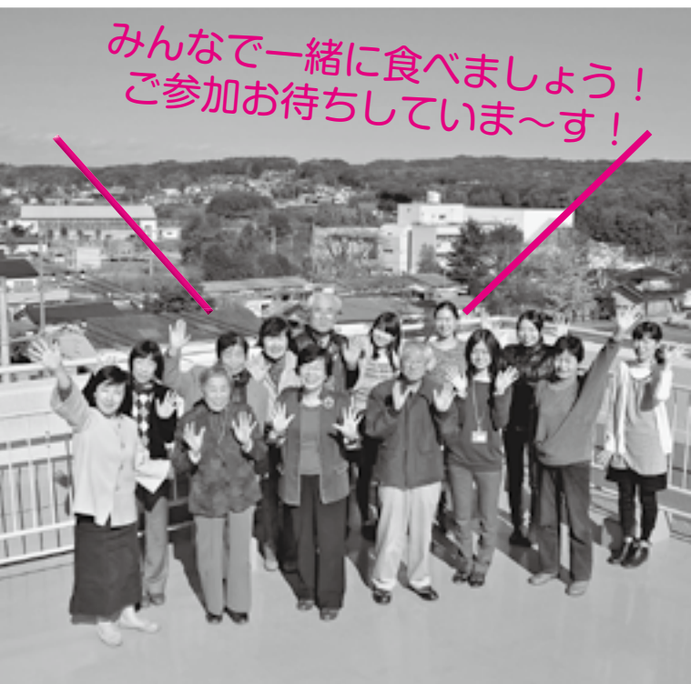
鳩山町食コミリーダーの皆さん