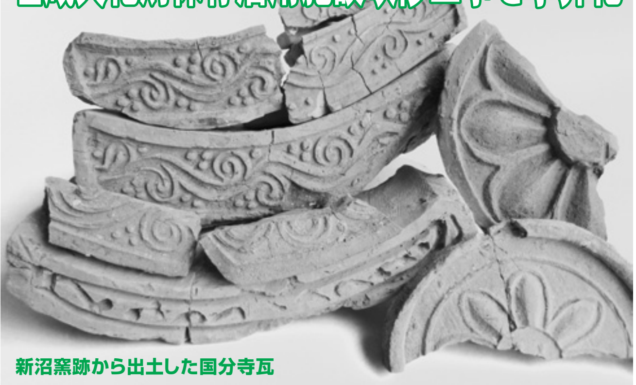
新沼窯跡から出土した国分寺瓦