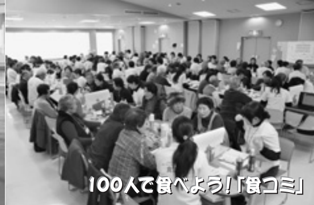
100人で食べよう!「食コミ」

平成26年第1回定例会が3月3日から3月14日までの12日間にわたり開催されました。町長から提出された議案は、町の条例に関するもの3件、埼玉県市町村事務組合の規約変更に関するもの1件、町営ニュータウン駐車場の指定管理者の指定に関するもの1件、平成25年度一般会計及び特別会計補正予算の議定に関するもの7件、平成26年度一般会計・特別会計及び企業会計予算の議定に関するもの8件、町営土地改良事業の経費の賦課基準並びにその徴収の時期及び方法に関するもの1件、工事請負契約の変更契約の締結に関するもの1件の合計22件でした。全議案とも可決されました。また、国に対する意見書が2件提出され、それぞれ可決されました。