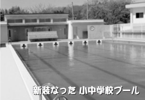
新装なった 小中学校プール