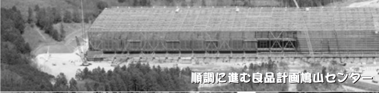
順調に進む良品計画鳩山センター