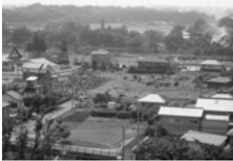
円正寺付近(赤沼・今宿)

を県と協議し提出します。県から適切との回答があれば町で縦覧することになり、特に意見書等がなければ県の許可、町の公告にて完了となります。説明を受けた後、委員からの質疑・意見を経て本件の調査を終了しました。(日坂)