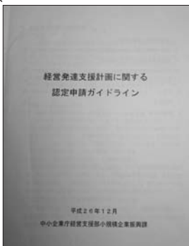
「経営発達支援計画に関する認定申請ガイドライン」