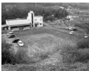
現在の学校給食センターと建設用地 (プロパンガスタンク跡)

問 県にも確認したが、それで問題ないということ。指導員も増やす方向で考えている。 問 企業誘致奨励金はどういう目的か。 答 町の企業誘致推進室が誘致した企業に対して3000万円が6年間、省エネの関係は1年間500万円。平成27年度は3500万円、それ以降3000万円が奨励交付金として交付するよう予算化されている。 問 橋梁定期点検業務委託料、どんな橋をどんなふうに点検するのか。 答 25の橋の点検をするため計上している。橋梁について、5年に1回は何らかの点検をすることが規則で定められた。 問 点検業務の内容は。 答 基本的に目視と、そばに行つて傷んでいないかなどを点検する。 問 目視・点検で、25橋で1000万円は高いように思うがどのように見積もりをとったのか。 答 橋梁の点検専門コンサル等に見積もりをとつ