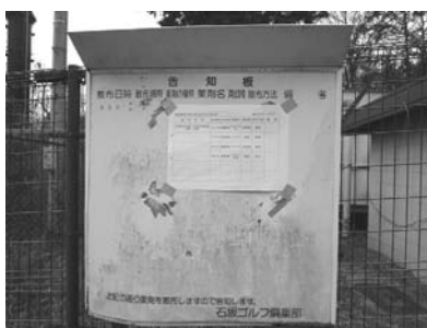
町の通知の効果あり 3月20日の石坂ゴルフ掲示板

今後のまちづくりは、町民みずからまちづくりや地域づくりを考え、行政と協働して実現していくという取り組みが必要である。