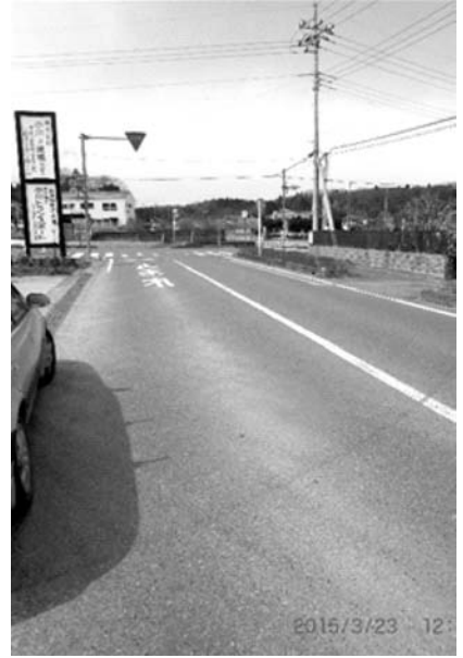
町道1号線の延伸計画(泉井)