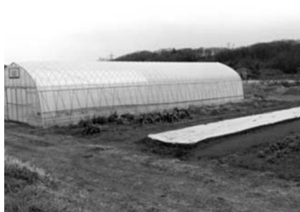
新規就農者の活躍場所 下熊井

答 平均すると1人当たり105アールとなる。補助金として最初の準備金を含め年間150万円が2年間、埼玉県から支給される。更に以後3年に渡り、年間150万円が埼玉県から支給される。