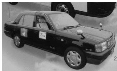
デマンドタクシー案内より