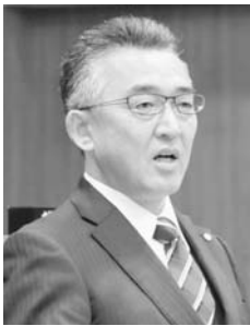
日坂 和久 議員