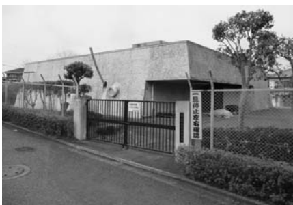
廃止された旧高台寺浄水場

答 梅沢集会所は、長野県内にあつた農家を昭和56年に日本新都市株式会社に移築し、平成16年に町が取得した。民間の葬祭場が近隣に整備され、使用が減少してきた。指定管理者は各種の事業を行い、利用者が増加するよう対策を講じたが、経費を賄える程の状況には至らなかった。新たな利用方法を模索している。