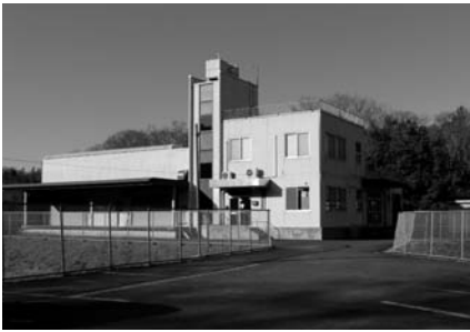
建設費の9割を町が負担し、建て替え予定の給食センター