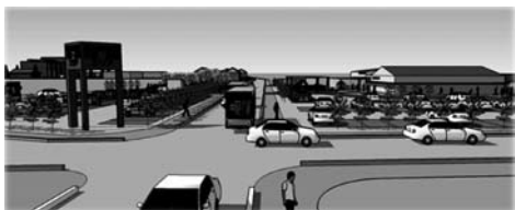
5年後の泉井中心部 (「泉井地区における活性化取組方針案」表紙絵)

答 町営路線バスを新設して泉井発、東松山市神戸葛袋経由高坂駅行きのルート設定に問題がある。画の中で検討したい。