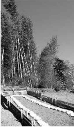
地方創生に活かしたい新沼業跡

④中山間地域創生事業。泉井地区活性化取組方針の具体化を図るための各種調査を委託するもの。