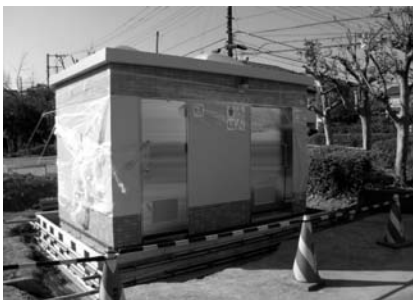
ジャンボ公園のトイレ