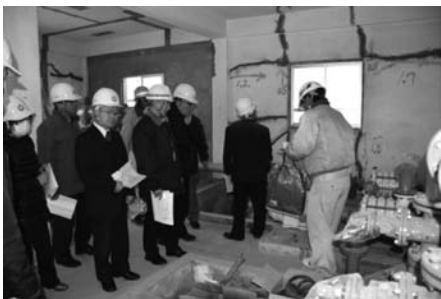
改修工事中の池田浄水場