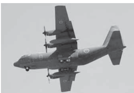
自衛隊戦術輸送機C 130