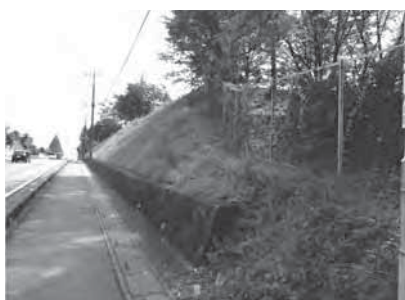
職員が行う除草作業の急斜面

答 主たる業務の間に行うことは、業務に影響が出る可能性が無いともいえない。職員の危険性、職場への影響を総合的に判断していく。