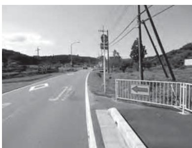
早期完工が望まれる県道東松山越生線（熊井地内）

答 本年10月に土地鑑定評価を行い、その後入札の告示をし、今年度中に売買契約ができればと考えている。