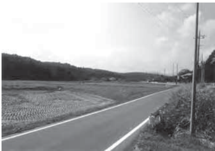
下熊井から上熊井地区を望む

答 当町では家がなかなか建てられない市街地調整区域がほとんどだが、集落機能の維持向上を考えると北部地域活性化各地区の取り組み事例を含めて考えていきたい。