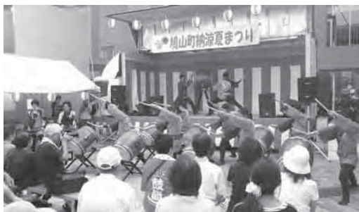
鳩山町納涼夏まつり(第2会場)

答 町内循環バスは毎年利用者が減少傾向にある。公共交通再編実施計画において既存の路線バスやデマンドタクシーなどの地域全体の公共交通網を最適化していきたい。