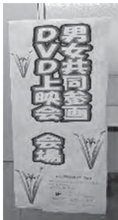
【統計にみる「仕事と生活」のいま】をテーマに（鳩山町役場）

8%を占めているが、管理職である課長は15人に対して女性はゼロ、課長補佐は14人に対して女性は2人。