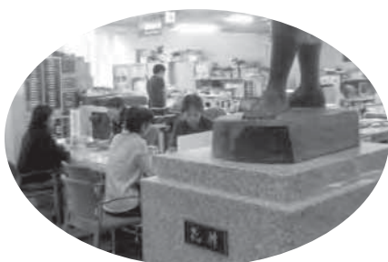
健康福祉課・高齢者支援課 窓口