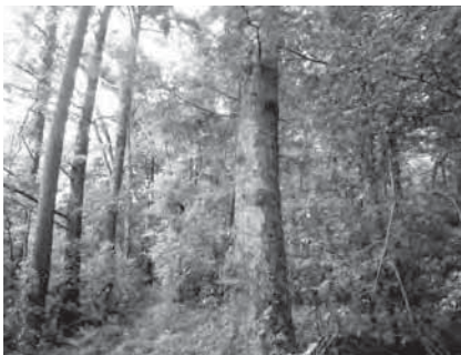
自然豊かな(通称)「熊井の森」貴重なモミの木の群生

答 問題が深刻化する前に早期発見、早期支援すること。孤立しない地域づくりをすすめること。相談支援体制を整備すること。関係機関と連携して必要な支援につなげていくこと。