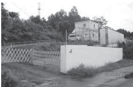
県道沿いに出来たプレハブ建築建造物（赤沼地内）

答 越辺川の未改修区間については、今川橋下流から始まった築堤工事が国分コンクリートの周辺を残して中断している。