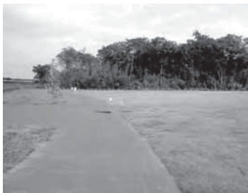
芝張り整備も進み利用者待つ親水公園

答 利用者に支障のない範囲で、定期的な植栽管理を限られた予算の中で行っている。現在も除草等で一部の方に自主的にお手伝いをしていただいている。今後も公園利用の皆様、できる範囲で、維持管理の協力をお願いできればと考えている。