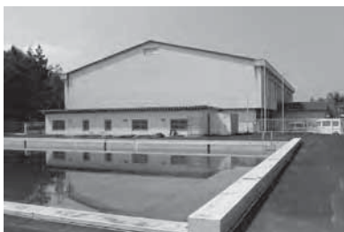
まもなく解体される(旧)松栄小学校のプールと体育館

問 資金繰り上、一時借り入れて急場をしのごく財政運営をしているようだが、将来を見据え、バランスの取れた町政運営をお願いしたい。