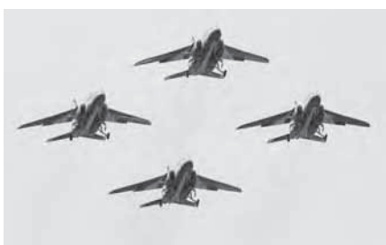
騒音被害が目立つ編隊飛行

答 プロジェクト委員会にて十分な検討を重ね、早い時期に収穫の安定化を図っていく。