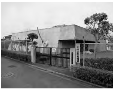
高台寺水道施設跡地

住民の皆様のご意見を踏まえた上で、再度検討を行い、話し合い等を持たせていただき、水道施設財産の有効活用を図っていききたい。