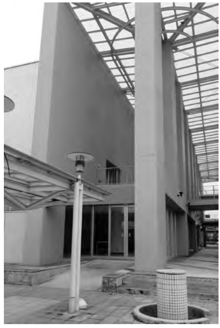
購入予定の旧西友リビング館