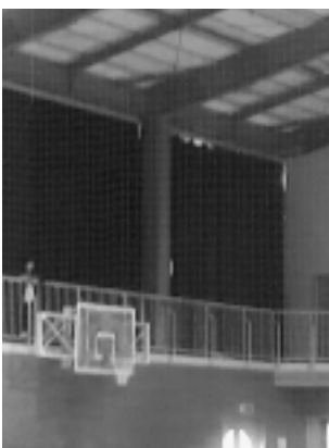
安心・安全のため万全な調査とメンテナンスを

※非構造部材とは 建物全体の構造設計、構造計算の対象になる構造体と区別した部材のこと（外壁・天井材・照明器具など）。