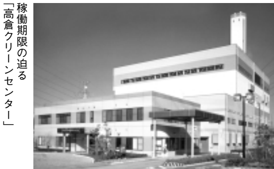
稼働期限の迫る「高倉グリーンセンター」

問 膠着状態の高倉グリーンセンター次期更新施設建設を前進する手だてを協働して模索したい。安心・安全が大原則のもと、焼却により発生する熱エネルギーを活用し、入浴施設・温水プールなど建設が可能か伺う。 答 発電後の排熱で、温水プールは隣接して建設はできる。 問 安心・安全に対する説明に不足は無いか伺う。 答 平成23年3月に建設計画の説明会を開催、視察研修の実施、公害対策等の説明会の開催。11月24日、専門家を招き意見交換会を実施したが反対者の意見のみで、理解を頂ける状況ではなかった。 今後とも施設の安全・安心に対する説明と並行し、要望の周辺事業案など意見交換の集会を考えている。 問 埼玉西部環境保全組合議員から鳩山町に対し、「次期更新施設は20年も前から鳩山