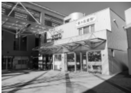
新設・開所したニュータウンふくしプラザ