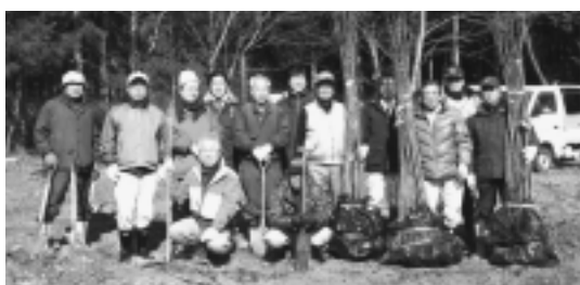
高年者の社会参加 あんずプロジェクト委員