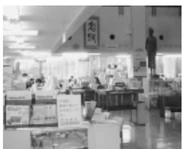
正規職員も臨時職員も共にいきいき働ける職場に

答 会員の中で解決していただきたい対応してきた。そうしたことではないと考えている。