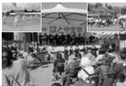
交通手段が無く、楽しい祭りに来られない方もいる

問 軽度の障害をお持ちの方は、介助なしでデマンドを利用できるが、場合によっては乗降時に声かけなどの