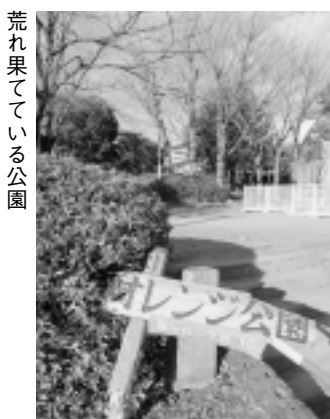
荒れ果てている公園

に数か所の公園の中高木の伐採強剪定を実施し、見通しの良い明るい公園に生まれ変わらせ、住民の反応をみて判断したい。