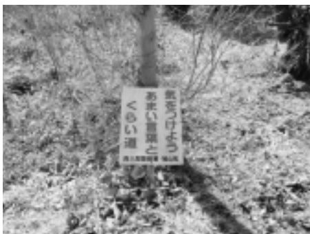
亀井小通学路にある防犯用立て札

答 小、中学校全部で52か所あった。それを整理して、県土整備事務所に報告し、具体的な対策をとっていく。例えば亀井小では大橋の交差点の路面表示。今宿小ではおしゃもじ山下の側溝のふたかけ工事、町道75号線の石坂と赤沼地内の照明工事。鳩山小では、松ヶ丘四丁目付近の植え込みの剪定を考えている。