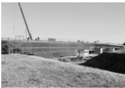
完成近い越辺川大橋

答 町内への流入道路も完成する、法的規制を解決し誘致の受け皿を確保して、物流業務・倉庫・荷捌き所などの施設を受け入れたいと考える。