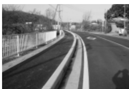
県道東松山越生線歩道整備工事、大橋奥田地内完成

開発許可が1月中に出れば、2月中には造成工事着工、その後、建屋の工事等になると考えている。