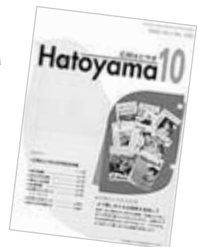
▲平成18年10月 発行の第400号

町民の皆さまとともに歩んできた「広報はとやま」が、本号で創刊500号となりました。49年間、さまざまな話題を伝えてきた「広報はとやま」。情報化社会となった今でも、皆さんのご家庭に直接お届けできる広報紙は、その存在価値がなくなることはないと考えます。 今後も「町民と行政、人と人をつなぐパイプ役」として、皆さまに親しまれる紙面づくりに努めてまいります。