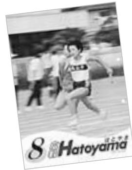
▲平成9年8月 発行の第300号