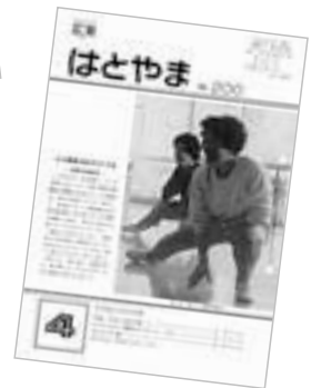
▲平成元年4月 発行の第200号