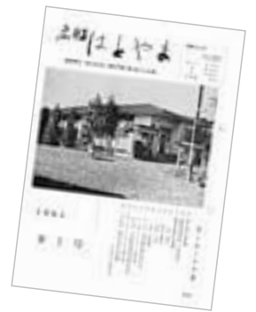
▲昭和39年3月 創刊時の第1号