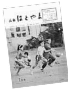
▲昭和56年1月 発行の第100号