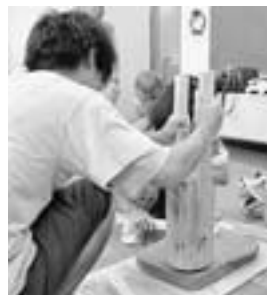
←8月31日、農村公園内で鳩山産粘土を使用した瓦を制作