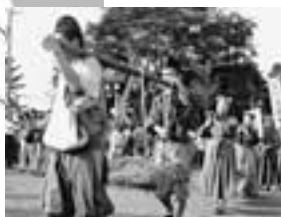
当時の服装などを再現した運上(運搬)作業

さらに今年には、「平成の国分寺造営でつなぐ古代瓦のふるさと鳩山再現事業」として、国分寺市まで瓦を運ぶイベントの出発式をはとやま祭会場で行います。このイベントは、武蔵国分寺の瓦生産という特需に沸いていた奈良時代を再現し、文化財の活用により地域活性化をねらうものです。武蔵国分寺を主たる文化遺産と位置づけ、現在整備工事を進めている東京都国分寺市と連携した一大イベントとして、関係者からも大きな期待が寄せられています。