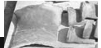
鳩山の粘土と鳩山↓の窯で焼いた瓦