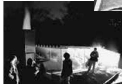
10月、農村公園内の復元窯で瓦を焼成