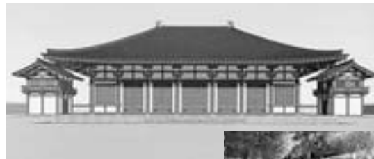
運上した瓦は整備中の国分寺講堂跡の基壇復元部分に設置（予定）