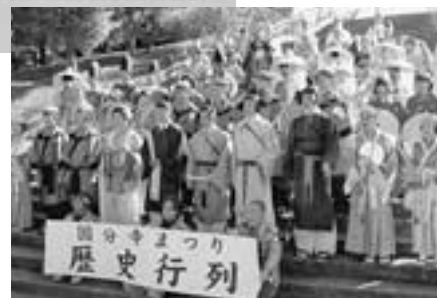
11月4日 国分寺まつりで受入式