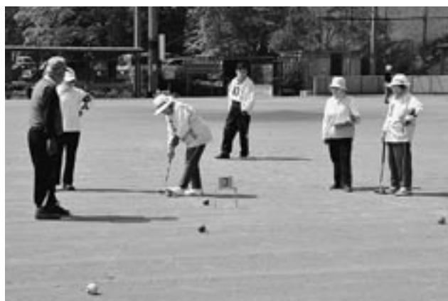
ゲートめがけてボールを打つ選手

5月10日、町体育協会主催、町ゲートボール連盟主管による第37回春季ゲートボール大会が梅沢運動場で開催されました。この大会には町内から約90人が参加し、地区別の15チームが互いに競い合いながら、親睦を深めていました。