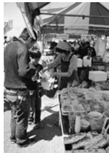
特産品をPRする味の会のブース

東松山市のやきとりなどのご当地B級グルメ・特産品と並び、味の会からは「鳩豆うどん弁当」や「田舎まんじゅう」などが、おしゃもじ会からは「田舎ちらし」や「匂ごはん」などが販売され、会場に訪れた多くの方に町の特産品をPRしました。