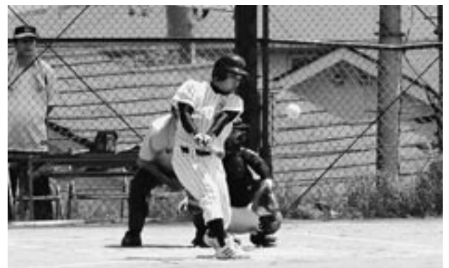
ボールを打つ選手(梅沢運動場)

比企郡体育協会主催による第47回比企郡民体育大会が、比企郡内の各会場で開催され、5月19日には町内にある梅沢運動場、亀井運動場、多世代活動交流センター運動場の3か所でソフトボールの試合が行われました。