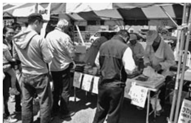
特産品をPRするおしゃもじ食品のブース