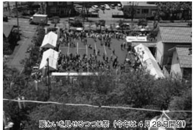
賑わいを見せるつつじ祭（今年は4月28日開催）