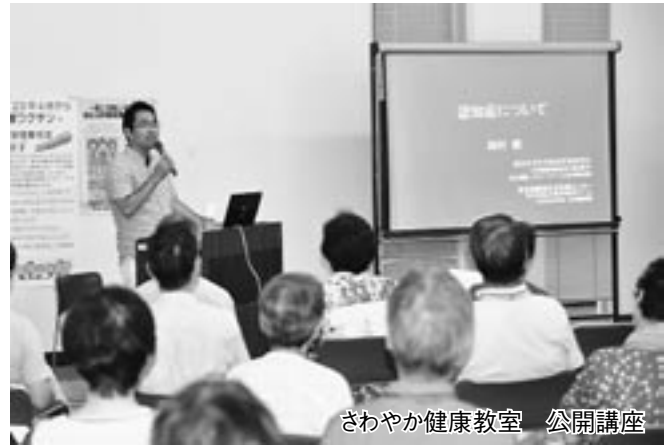
さわやか健康教室 公開講座