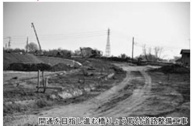
開通を目指し進む橋りょう取付道路整備工事

入西赤沼線整備工事 ●5,250万円 鳩山町(赤沼地内)と坂戸市(入西地内)を結ぶ入西赤沼線工事費です。平成26年3月末の開通を目指し、橋りょう取付道路の整備工事を行っています。