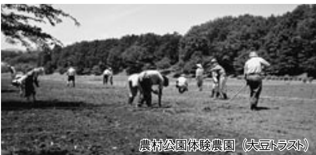
農村公園体験農園 (大豆トラスト)