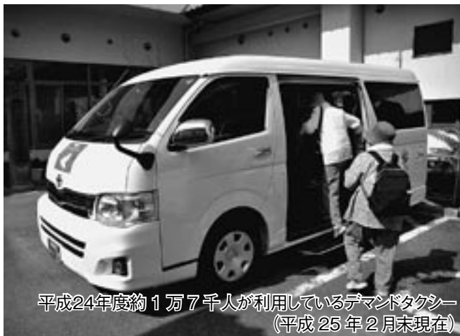
平成24年度約1万7千人が利用しているデマンドタクシー（平成25年2月末現在）