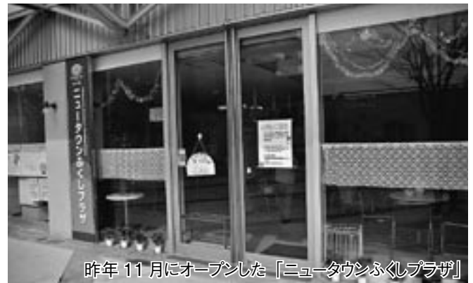
昨年 11 月にオープンした「ニュータウン福祉プラザ」