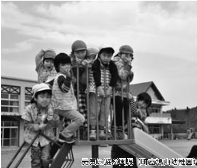
元気に遊ぶ園児 (町立鳩山幼稚園)