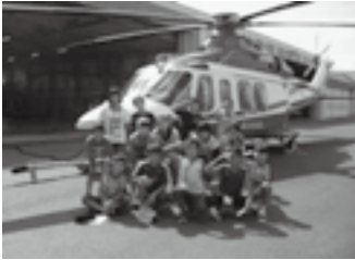
夏休み子ども体験教室

管内の小学4～6年生を対象に毎年夏に開催している体験教室です。災害の模擬体験をしたり、展示物を自分で操作したりすることで、防災についての基礎知識や災害が発生したときの対処方法を学ぶことを目的に行っています。子どもたちからも好評な教室です。