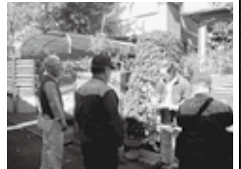
住宅用火災警報器設置推進啓発事業

消防組合では、地域の皆さんが安心・安全に暮らせるよう住宅用火災警報器設置の推進をしています。設置推進のモデル地区では、啓発や設置支援のために消防職員や地域で委嘱された推進員が各家庭を訪問しています。お伺いした際には、ご協力をお願いします。