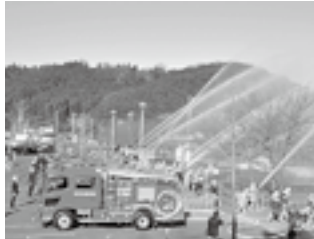
3町消防団との連携

消防本部は、3町にある消防団の事務も行っていきます。消防団と消防署は、日々の活動での連携のほか、出初式や連合特別点検などでも協力をしています。しかし、各町とも団員が不足しているのが現状です。消防本部では、地域を守る消防団員を随時募集しています。