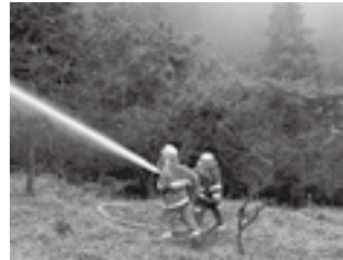
山林火災防御訓練

管内には山林が多いため、山林火災は想定しなくてはならない火災のひとつです。山林火災は、一般の火災と比較して、火災の発生に気づきにくいなど困難性が高い火災です。そこで消防署では、3町の消防団と県防災航空隊と連携して合同訓練を実施しています。