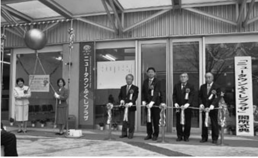
開所式の様子（写真上） サロンでボランティアスタッフと話しをする来所者。（右）

ニュータウンふくしプラザが11月24日（土）、タウンセンター1階にオープンしました。プラザの運営は、町から委託を受けた町社会福祉協議会が行います。プラザには専任の担当者を配置し、サロン事業や福祉に関する様々な相談、ボランティアの支援などに取り組みます。