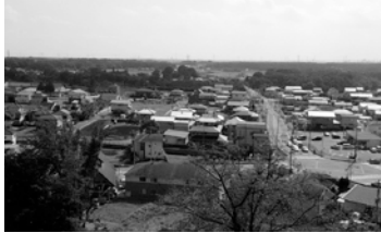
整備が進んだ区画整理地内

補助対象期間は、平成7年度から平成29年度で、社会資本整備総合交付金などの補助金が活用できる期間となる。事業計画は現在までに