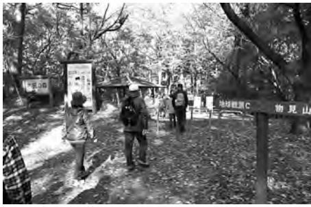
東松山市と協働で行われた「モリ×モリウォーキング」

答 東松山市との協働プロジェクトで、ウォーキング事業を開催している。負担金を鳩山町と東松山