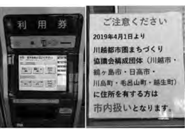
サンテ坂戸プール利用券券売機と注意書き。鳩山町は？

約8億円で半分の約4億円を補助金で賄うはずが、1億3千万円強しかもらえないこととなった。不足分はどうするのか。 答 農林水産省との協議で、児童館等が対象外となり、減額となった。町の重要施策であり、令和2年度に完了する。不足分の約5億9千万円は町債で資金調達する。 サンテ坂戸の利用料金 問 プールを利用した時、川越まちづくり協議会に鳩山町が未加入のため、周辺他市町より利用料が高いとのこと。なぜ加入しないのか。 答 内部で検討を始めており、今後調査研究していききたい。