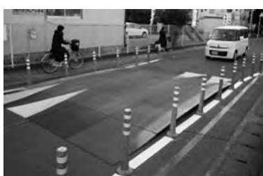
速度低減を促すため貸し出し可搬型ハンパの設置を推進