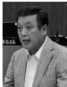
森 利夫 議員