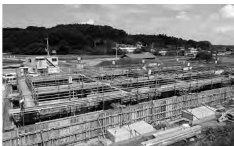
建設工事が始まった上熊井農産物直売施設

答 ソフト事業で日帰り型都市交流を検討する。宿泊型の体験交流施設の整備は、財政面から困難と考える。