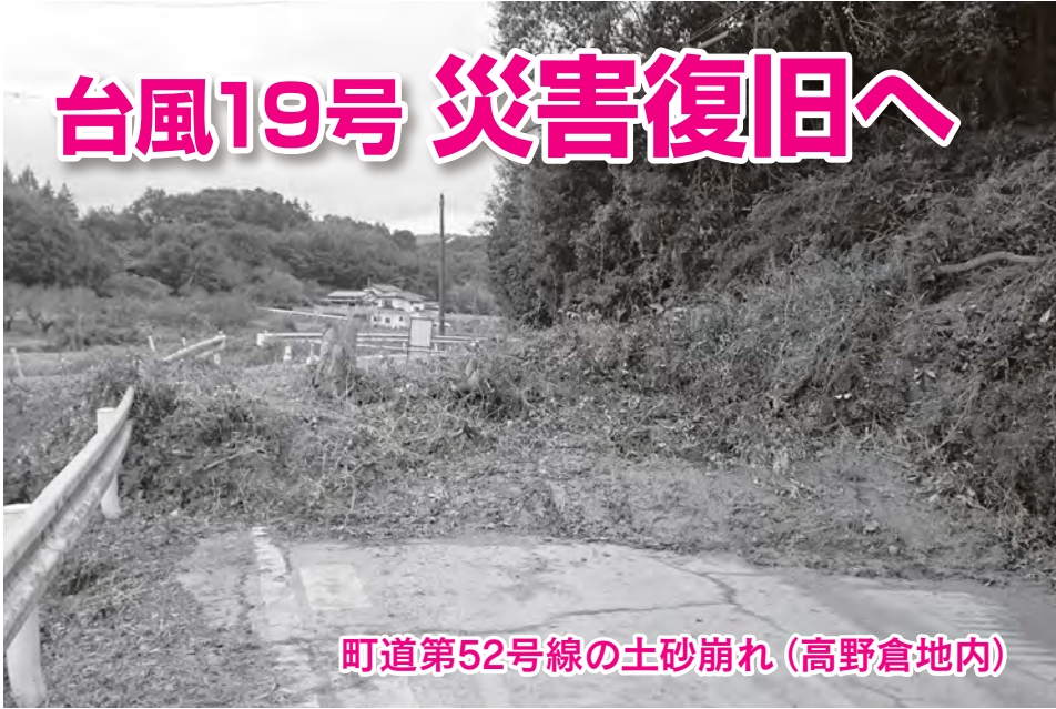
町道第52号線の土砂崩れ(高野倉地内)

令和元年第4回定例会が、12月3日から11日までの9日間にわたり開催されました。提出議案は、専決処分承認に関するもの1件、条例の制定に関するもの6件、指定管理者の指定に関するもの2件、令和元年度一般会計及び特別会計、並びに企業会計補正予算の議定に関するもの5件、工事請負契約の変更契約の締結に関するもの1件、人事に関するもの1件の16議案で、いずれも承認・可決・同意されました。請願1件が提出され、採択されました。そのほかに議員発議が1件提出され、可決されました。