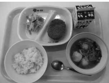
今年の4月から 値上がりする学校給食