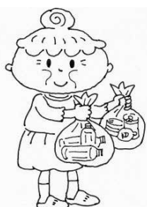
ごみはどこへ持っていきばいいのかしらっ?

答 銀河の丘、逆川沿公園は、梅沢運動場にトイレが整備されているので、一定の環境は整っている。