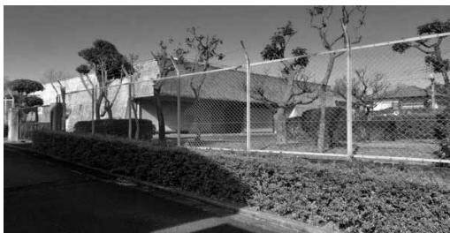
具体的な処分を検討する旧高台寺浄水場

答 不妊治療を実施し無 秩序な繁殖を防ぎ、所有 者不明猫の住民への生活 環境被害軽減を図る事業