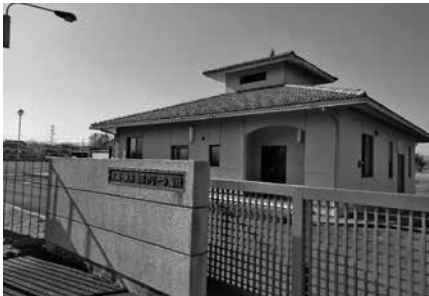
大橋・泉井地区クリーン施設