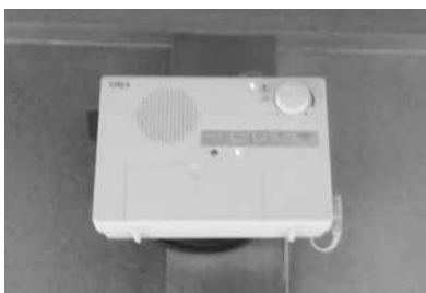
越生町の住宅に配備された戸別受信機