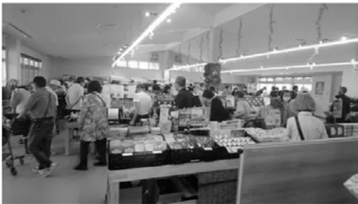
「ちよっくま」オープン初日のにぎわい

なお委員からは、取扱商品、イートインスペースの活用、イベントの開催等、多数の質疑や意見がありました。