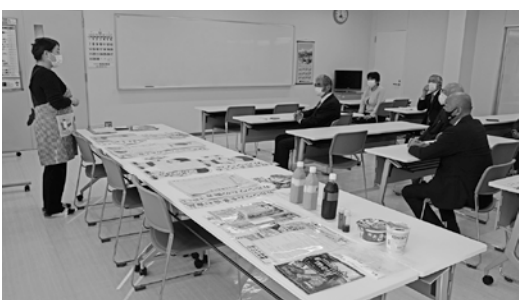
栄養教諭より食育について勉強中

ジャムとして加工し、カレーに加えたり、アンズソースとして唐揚げと絡めるなど工夫をして、子どもたちに提供しているそうです。地場産の食材を使用することの課題は、1つの品目を大量に仕入れること、作物の旬を過ぎるとまとまった数量の入荷が難しいことです。また、給食センターが毎月児童・生徒に発行している「食育だより」の中には、お正月やお彼岸、七夕、十五夜などの季節行事と、食に関することの説明を広く掲載して、食生活と密着しています。各学年では、栄養教諭が中心となつて、食育教育も行っているとのこと。今後についても、鳩山町の将来を担う子どもたち