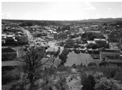
おしゃもじ山展望台より今宿地区を見晴らす

問 おしゃもじ山公園の管理はどのように行っているのか伺う。 答 植栽の維持管理及び公園の清掃業務を毎年、鳩山町シルバー人材センターに委託し、定期的な維持管理を行っている。業務内容は、つつじの育成に重点を置いた剪定また追肥などを実施している。 問 石碑が倒れているが、その対応は。 答 再設置場所を踏まえた修復方法等の検討をしている。 問 公園北側の竹やぶの管理について伺う。 答 現時点で伐採等の予定はないが、隣接する土地所有者のご意見を伺いながら、今後の方向性を検討していく。 問 展望台の塗装が剥がれてきているが、点検はしているのか。 答 平成14年度に展望台の耐震診断、平成26年度に展望台の塗装の塗り替えを行っている。今後とも適切な安全点検に努めていく。