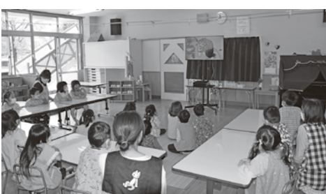
デジタル絵本に見入っている、鳩山幼稚園の子どもたち

本の貸出冊数は1人1回につき2冊までできること。読み聞かせの活動については、本に親しみ