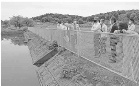
昨年度に改修した新沼を視察