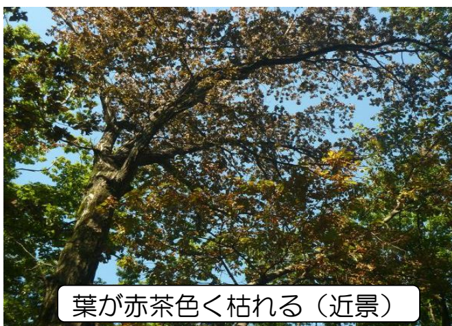
葉が赤茶色く枯れる（近景）