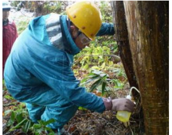
立木薬剤注入処理