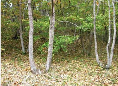
管理されているコナラ林

放置されたナラ林は、高齢化・大径木化し、カシノナガキクイムシにとって繁殖しやすい状況となり、被害が拡大しているといわれています。