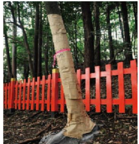
粘着シート被覆

樹幹に被覆材（粘着剤、ビニール等）を塗布又は巻き付けることによりカシノナガキクイムシの穿入及び脱出を防ぎます。