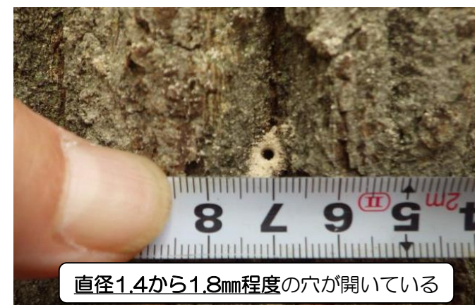
直径1.4から1.8mm程度の穴が開いている