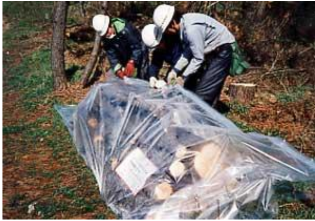
伐倒・くん蒸処理