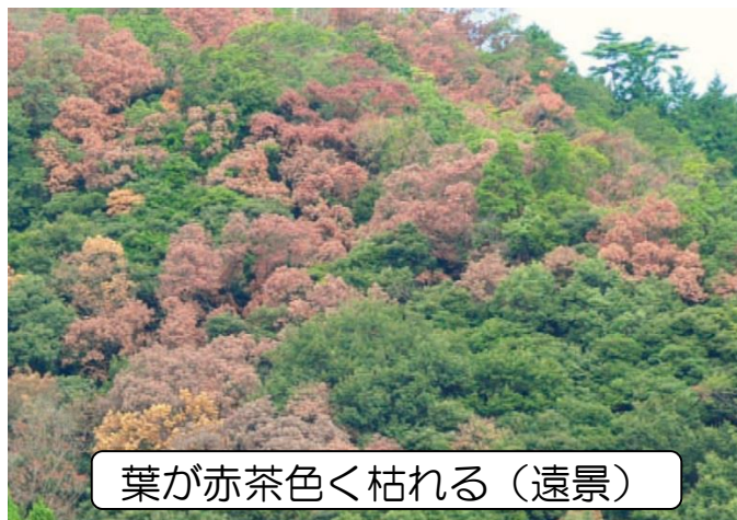
葉が赤茶色く枯れる（遠景）

次の写真のようなナラ枯れが疑われる木を発見した場合は、市町村役場もしくは下記の県の機関までご連絡ください。