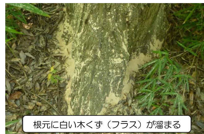
根元に白い木くず（フラス）が溜まる