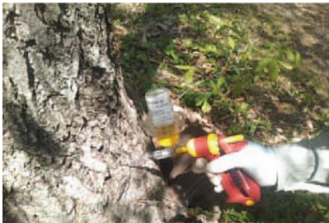
殺菌剤樹幹注入