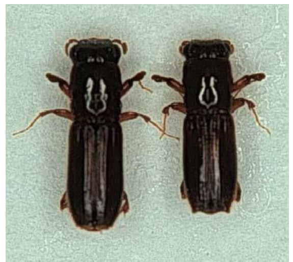
カシノナガキクイムシ メス成虫とオス成虫

カシノナガキクイムシが木に穿入し、体に付着したナラ菌（カビの一種）を感染させ、繁殖することで、水を吸い上げる機能を阻害するためです。