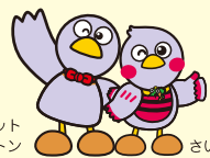
埼玉県のマスコットコバタン さいたまっち