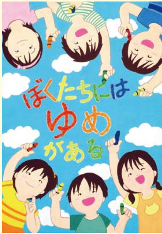
作者：加須市立加須西中学校 松村史紗 (平成14年最優秀賞)