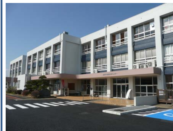
多世代活動交流センターは、平成30年度に「ニュータウン地域再生・創造事業」の取り組みとして、施設全体の耐震補強及び改修工事を実施しました。