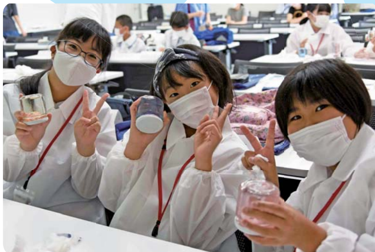
今月号では、7月22日に実施した子ども大学はとやま第1回「スノードームをつくらう」で、自作のスノードームを持つ小学生たち(関連記事26ページ)

※投稿多数時は1号に複数枚掲載する場合があります。また、掲載月のご希望に沿えない場合があります。