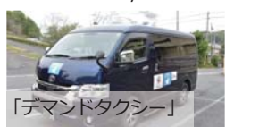
「デマンドタクシー」