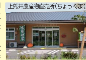
上熊井農産物直売所(ちよっくま)