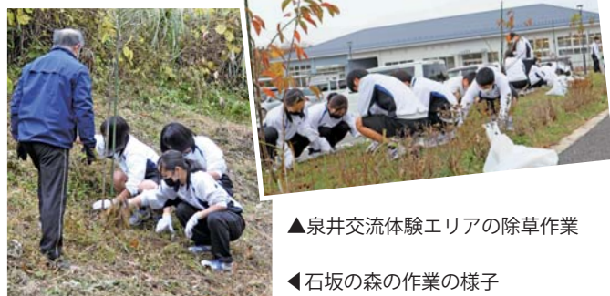
▲泉井交流体験エリアの除草作業