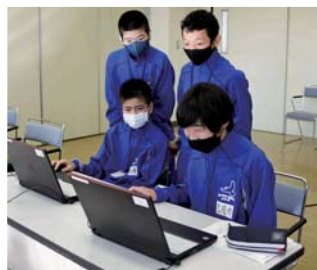
◀鳩山町役場でSNSへの投稿記事を作成。