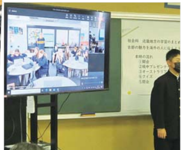
▲オーストラリアのマウントバーカーの生徒とオンラインで交流授業を行いました。