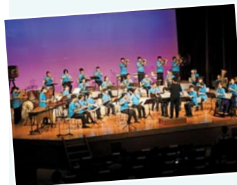
▲8月27日(土)、28日(日)に実施された「未来へはばたけ !!HATOYAMA SUMMER FESTA2022」での演奏の様子

令和4年度は、県大会及び西関東大会に出場し、代表に推薦され初出場した「第22回東日本学校吹奏楽大会」で金賞を受賞。また、「第46回県アンサンブルコンテスト中学校部門西部地区大会」で打楽器5重奏及び木管8重奏がそれぞれ金賞を受賞しました。その他、「鳩山町人権問題を考える町民のつどい」など、町の行事で演奏していただいています。