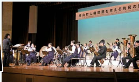
▲12月3日(土)に実施された「鳩山町人権問題を考える町民のつどい」での演奏の様子