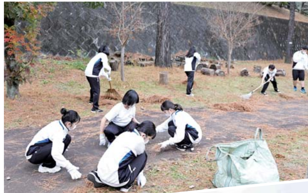
農村公園の清掃作業

前回までは、生徒会が中心となり除草作業を行ってきましたが、今回は、1年生が参加し、実施されました。生徒たちからは、「ハトミライの活動を知る機会となって良かった」という声が多くあがっていました。