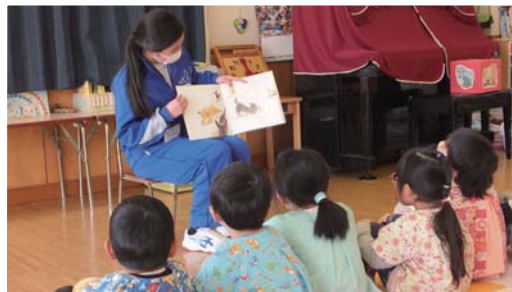
◀幼稚園で絵本の読み聞かせを体験。

鳩山町役場で、公式SNSへの投稿記事を作成した生徒は、「文章を普段考えることがなかったので難しかった」「作成してみても楽しかった」「写真を撮影するのが難しかった」などと感想を話していました。