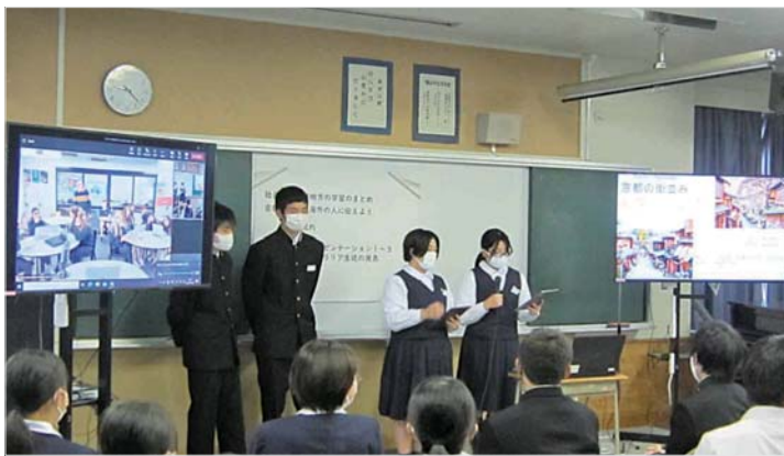
▲鳩山中学校の生徒は、修学旅行先の京都について調べたことを発表し、オーストラリアの生徒たちは、マウントバーカーの紹介を行いました。

めるところなどを見ていると、やはり働き場所が少ないと感じ、それが若い人が外に出てしまつて少子高齢化に繋がる原因になっているのではないかと思っています。私も高校生になったらアルバイトを経験したいと思っています。そのアルバイトをする場所も少ないので、小規模なもので良いから、働き場所が増えたら良いと思っています。