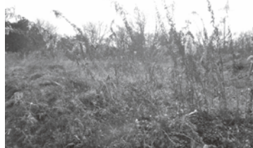
増加する耕作放棄地