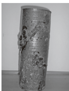
ロマンを秘めたまぼろしの熊井焼

答 教室や活動場所では、常時換気を行う。出入り口には消毒液の設置。また、机の位置を工夫。修学旅行については小学校3校とも、予定通り日光方面へ実施することができた。