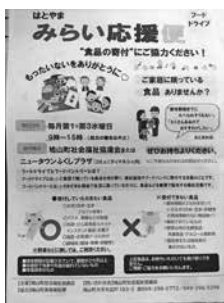
はとやまみらい応援便

問 現在では町民の支援だけである。 問 着なくなった服、文房具など広げることではできるか。 答 すでに埼玉県社会福祉協議会で実施している。 農業行政 問 農業従事者が10年前と比べると、33・6%減少していると言われる。町の考えは。 答 若い世代の新規就農者の確保、家族経営の後継者の確保、法人経営の規模の拡大の3点で対策に取り組む。 問 鳥獣被害対策実施隊は何人。 答 現在14人が活動中。 問 狩猟免許試験手数料を助成できるか。 答 検討課題としたい。