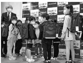
富山県立山町のランドセル