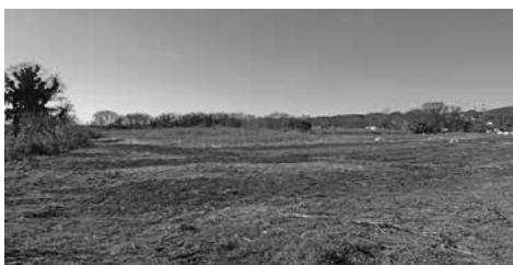
建ぺい率50を60%に、容積率100を200%に変更方針の仮宿地域

問 豪雨災害復旧費用約3億円を財政調整基金(以下財調とする)から支出したが、中期財政見直しでは財調残高が減少