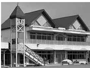
鳩山幼稚園に3年保育の実施を