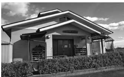
おしゃもじ山クラブ さらなる環境整備を