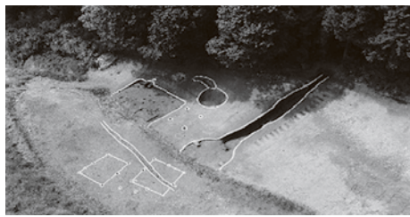
石田遺跡第1次A区1号窯・1号竪穴建物全景(北東から)