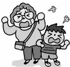
みなし道路の杭など「誰か撤去して」

試験など）をする必要があるため。 2024年の介護保険改定について 問 ケアマネジャーの有料化はどうなる。 答 介護保険から10割給付である。 問 軽度者（要介護1、2）が外され、町の総合事業に移行されると聞く。また、保険料の納付年齢が引き下げられ、介護サービス利用年齢は引き上がるとも聞く。それにより、鳩山では準備基金が増えすぎるのではないか。 答 国の部会の議論を注視していく。鳩山においては、低い額の保険料になるよう事業を進めたい。