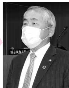
小川 唯一 議員