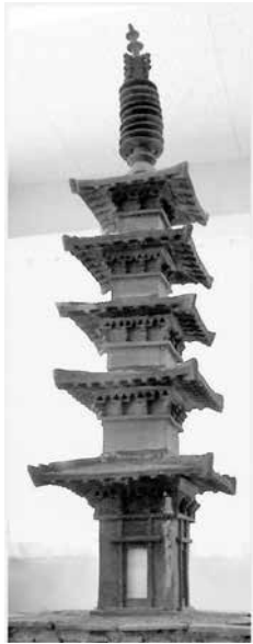
ボランティアにより焼成された瓦塔