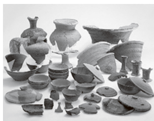
新沼窯跡出土須恵器

指定区域は赤沼地区の石田遺跡、泉井地区の天沼遺跡と新沼窯跡になります。一部地権者の同意が得られず、今回の範囲は限定的ですが、引き続き今後も保護を要する範囲として設定しています。国指定後の令和5年度は