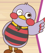
埼玉県マスコット「さいたまっち」