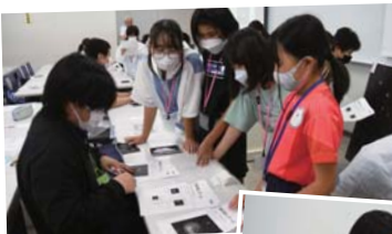
▲銀河博士になるためには、全問正解しなくてはなりません。丸付けもドキドキです。