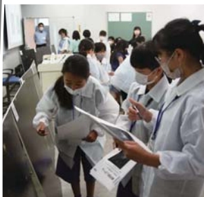
▶銀河探しゲームの様子