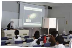
▲大学の先生の講義を聴く貴重な機会でした。