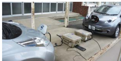
▲電気自動車から電力を供給し、避難所が停電していても電気を使えるようにします。

埼玉県議会が中心となっていく県内一斉防災訓練「シェイクアウト埼玉」について、裏表紙(24ページ)でお知らせしています。ぜひご参加ください。