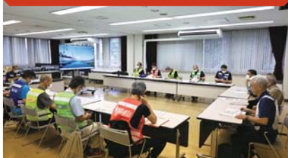
▲災害対策本部を立ち上げ、災害時の町の役割を確認しています。