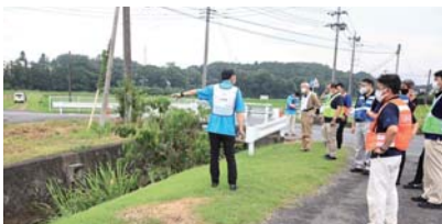
▲過去に被災・浸水した箇所やセンサ等の設置場所を確認しました。