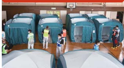
▲今宿小学校体育館に避難所を開設する想定で訓練を行いました。