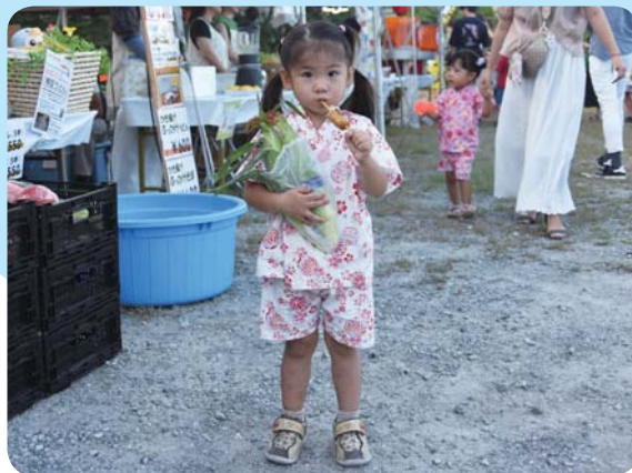
▲8月5日(土)の納涼夏まつりにて出店のお団子を食べる女の子

※投稿多数時は1号に複数枚掲載する場合があります。また、掲載月のご希望に沿えない場合があります。