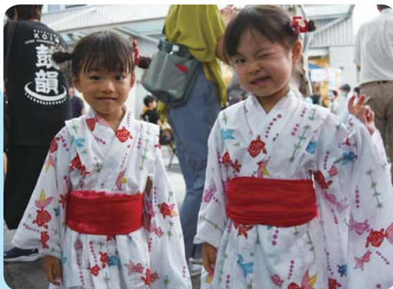
▲8月6日(日)の鳩山ニュータウン夏祭りにて、おそろいの浴衣を着た双子ちゃん