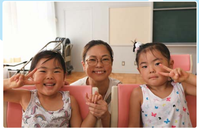
8月26日(土)に実施した子育て懇談会にご参加いただいた親子を掲載しています。(関連記事 21 ページ)

※投稿多数時は1号に複数枚掲載する場合があります。また、掲載月のご希望に沿えない場合があります。