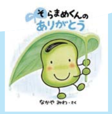
そらめくんの ありがとう