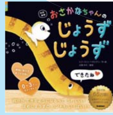
おさかなちゃんの じょうずじょうず