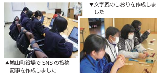
▲鳩山町役場で SNS の投稿記事を作成しました