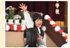
▲先生に名前を呼ばれ返事をする新1年生(今宿小)

4月9日(火)には鳩山幼稚園で入園式が行われ、かわいらしい新入園児が、園での集団生活をスタートしました。 入園式では園長先生の話を聞き、返事やあいさつなどを、大きな声で一生涯懸命に行っていました。