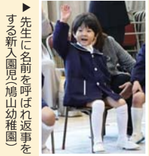
▶先生に名前を呼ばれ返事をする新入園児(鳩山幼稚園)

今年度の新入生数は以下のとおりです。 鳩山幼稚園: 4人 亀井小学校: 11人 今宿小学校: 34人 鳩山小学校: 20人 鳩山中学校: 61人