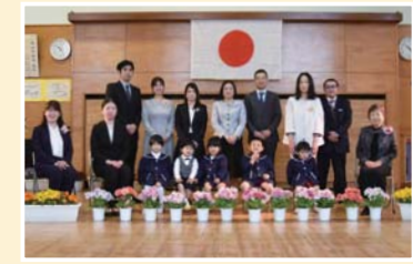
▲今年入園した園児とご家族(鳩山幼稚園)

4月8日(月)、町内の各小中学校で入学式が行われ、先生や保護者、上級生らが新1年生の門出を祝いました。 上級生とともに入場した新1年生の顔は緊張していましたが、校長先生などの話をしっかりと聞き、名前を呼ばれると大きな声で返事をしていました。