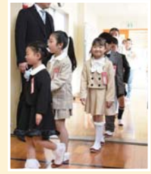
▲入場する新1年生(今宿小)

4月8日(月)、町内の各小中学校で入学式が行われ、先生や保護者、上級生らが新1年生の門出を祝いました。 上級生とともに入場した新1年生の顔は緊張していましたが、校長先生などの話をしっかりと聞き、名前を呼ばれると大きな声で返事をしていました。