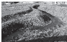
改修工事の予算がついた辻川

子育て支援関連の予算は年々増加している。将来を見据えれば、大切ではあるが、首をかしげたくなるような施策もある。移動が困難なお年寄り等を対象に配食サービスや買い物支援等に予算配分を増やしてほしい。