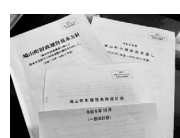
町の財政運営の各計画

一方で「企業誘致」がとん挫しており、自主財源の確保策が進んでない。「ふるさと納税」はもちろんだが、鳩山町の魅力を大いにアピールし、「移住推進」に取り組み、町の活性化や、今後の安定財源の確保を果たすべき。