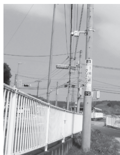
大橋交差点に設置されている防犯カメラ

防犯カメラの設置や橋りょう長寿命化修繕計画にも取り組むふるさと納税がネットで完結することになる。期待している。