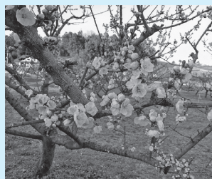
あんずの花見客に期待

新町政という期待もあったが、従来と大差ない予算書だった。特に、公約の農業支援とブランド化に注目したが、具体的な施策が見えてこない。アズノの花見などで集客し、今後の町の活性化に期待している。