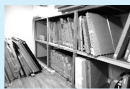
24時間、温湿度管理の美術品庫

将来的に利活用の計画がない公有財産は売却処分し、住民サービスの原資となるよう公売方法の見直しを検討すべし。