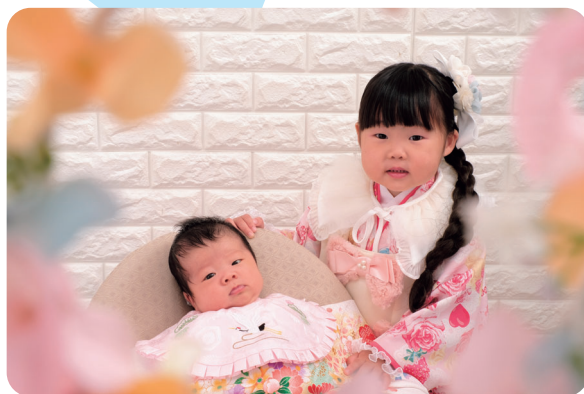
みゆうの愛優ちゃん、のあの暖愛ちゃん

※投稿多数時は1号に複数枚掲載する場合があります。また、掲載月のご希望に沿えない場合があります。