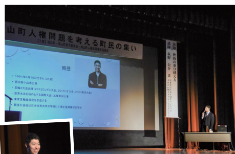
▲「挫折の乗り越え方」と題したご講演をいただきました。