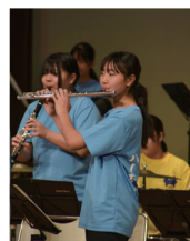
▲鳩山中学校吹奏楽部による演奏