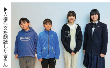
▲人権作文を朗読した皆さん