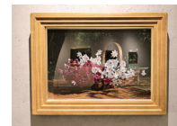
▲コスモス(油彩・20号)